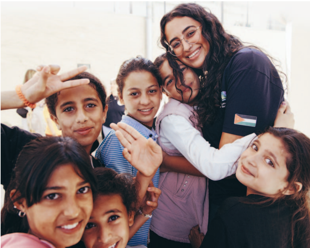
I et land der bare rundt tre prosent av befolkningen er kristne og over halvparten er under 24 år, arbeider Bibelselskapet for å videreformidle evangeliets håp og fremtidstro til en ny generasjon jordanere og flyktningbarn.