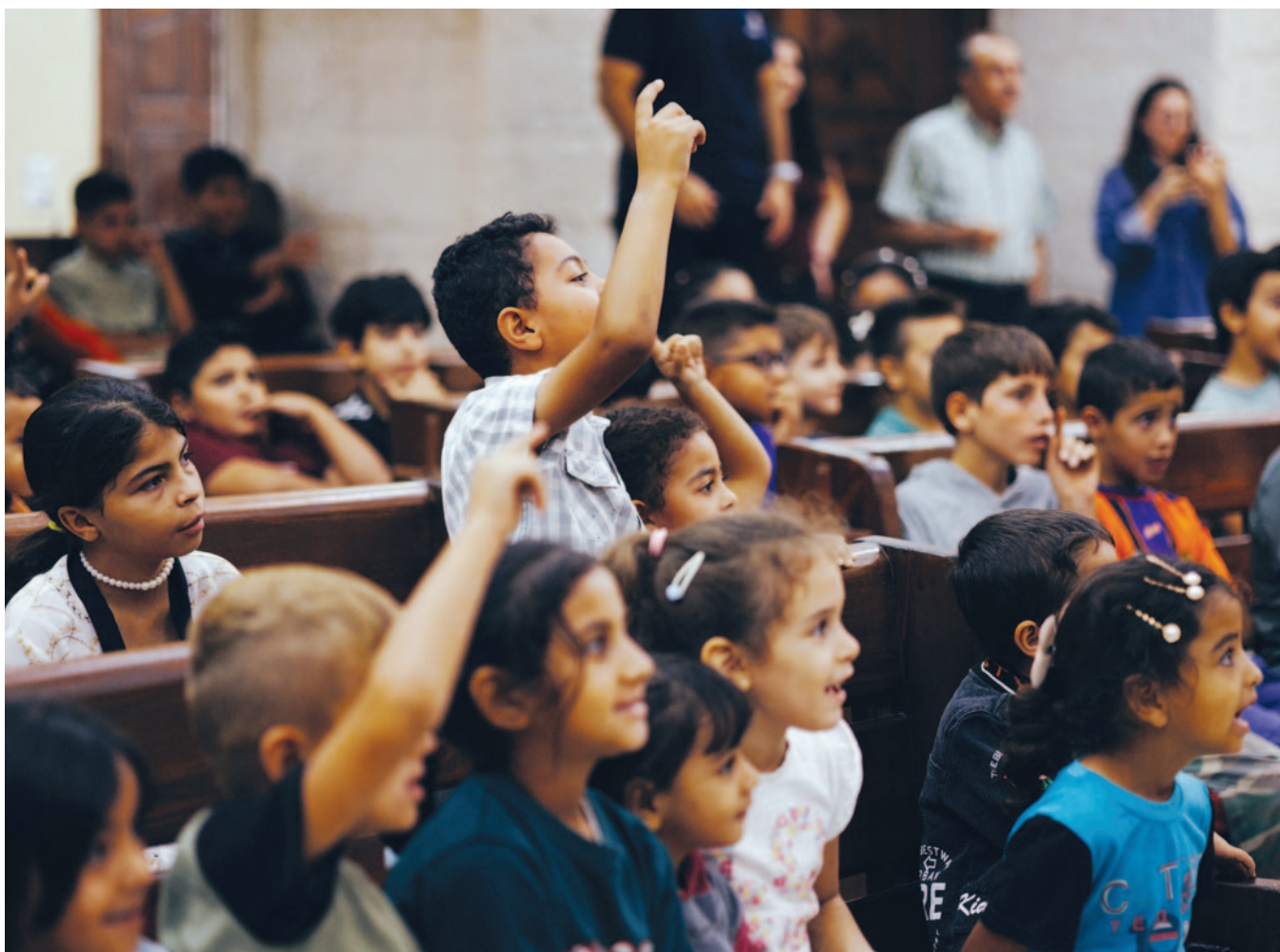
Barn fra Mafraq og de nærliggende flyktingleirene samles i kirken der Bibelselskapets ungdomsteam formidler fortellingen om Daniel i løvehulen.