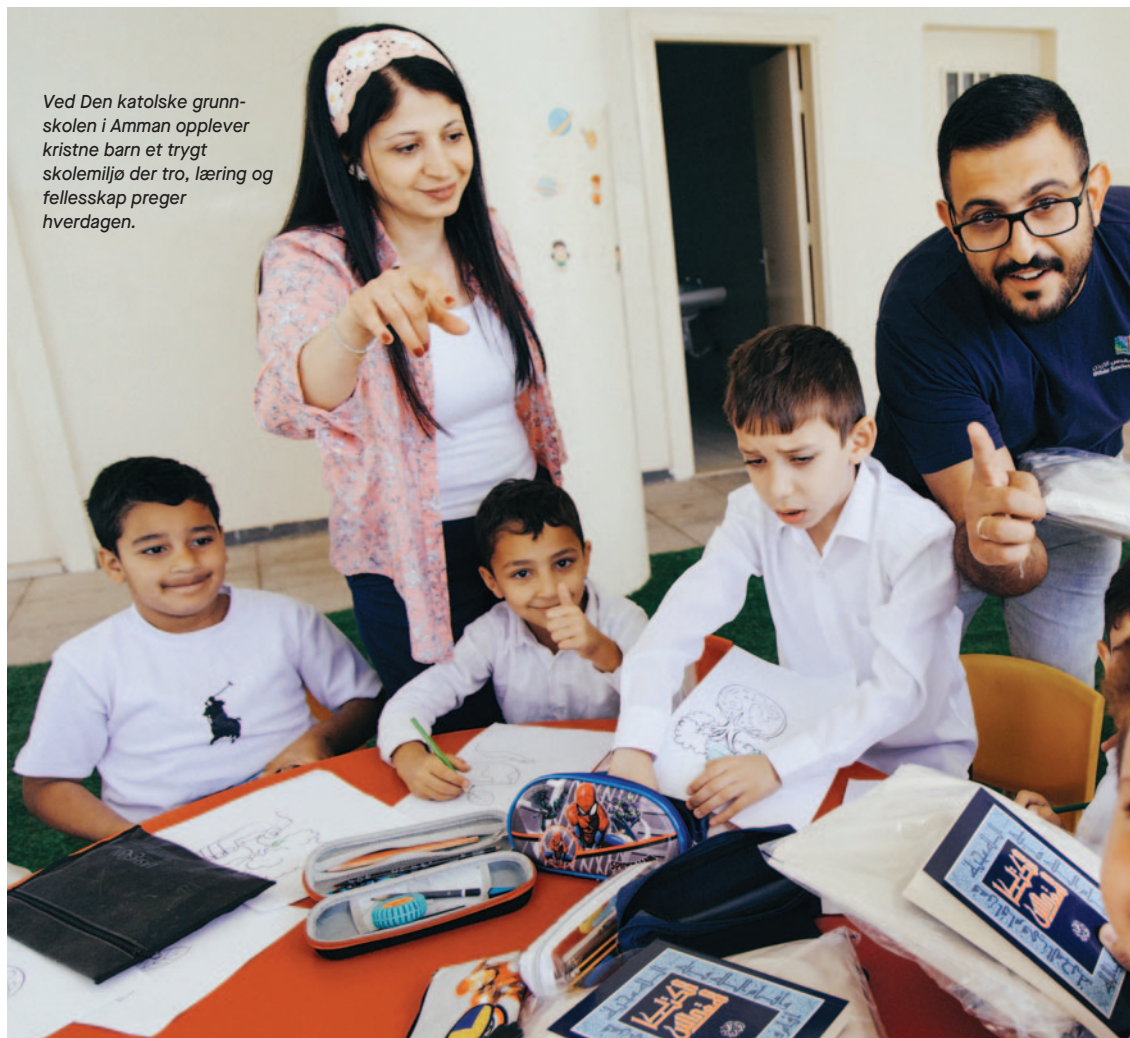
Ved Den katolske grunn-skolen i Amman opplever kristne barn et trygt skolemiljø der tro, læring og fellesskap preger hverdagen.

– Bibelen betyr mye for meg. Kjernen i evangeliet er at Jesus kom og døde for oss for å gi oss tilgivelse. Når jeg ber, merker jeg at det gir meg styrke, sier hun.