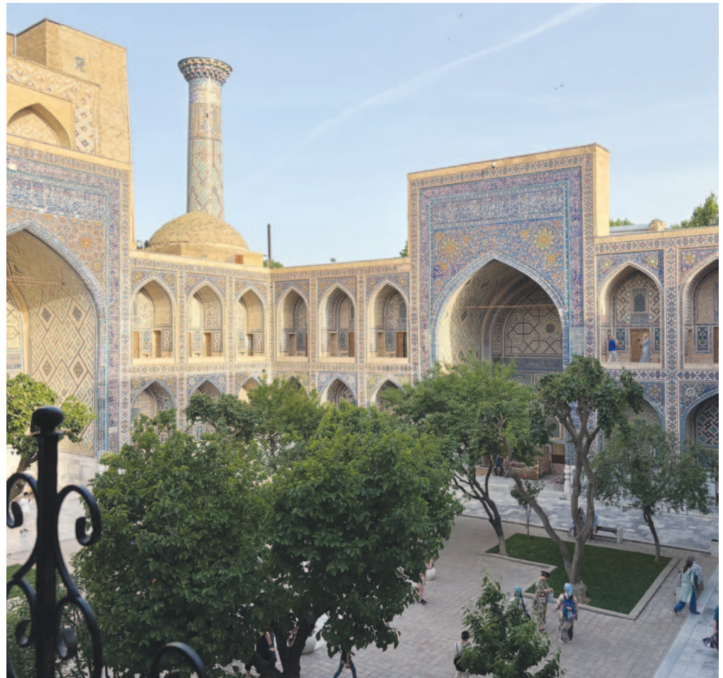
Sher-Dor-madrasaen på Registan i Samarkand, Usbekistan, vitner om storhetstiden på 1600-tallet, med overrådig mosaikk, kalligrafi og arkitektur som speiler islamsk tro, kunnskap og fellesskap. Den kristne minoriteten i regionen lever med denne majestetiske muslimske kulturarven som bakteppe.