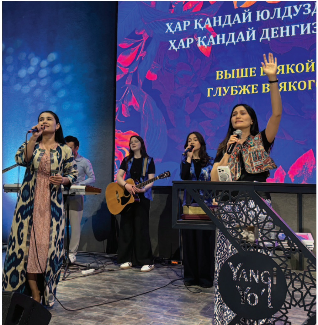
I menigheten Yangiyol, utenfor Tashkent hovedstaden i Usbekistan, samles unge og gamle til lovsang og gudstjeneste – men presten er dypt bekymret for at en hel generasjon vokser opp uten bibler på et språk de forstår.

– En hel generasjon unge vokser opp uten bibler på et språk de kan lese. Vi trenger titusenvise av bibler bare i vårt kirkesamfunn, ellers mister vi muligheten til å grunnfeste ungdommene i troen. Dette er virkelig en krise, sier pastor Jacob utenfor Tashkent.