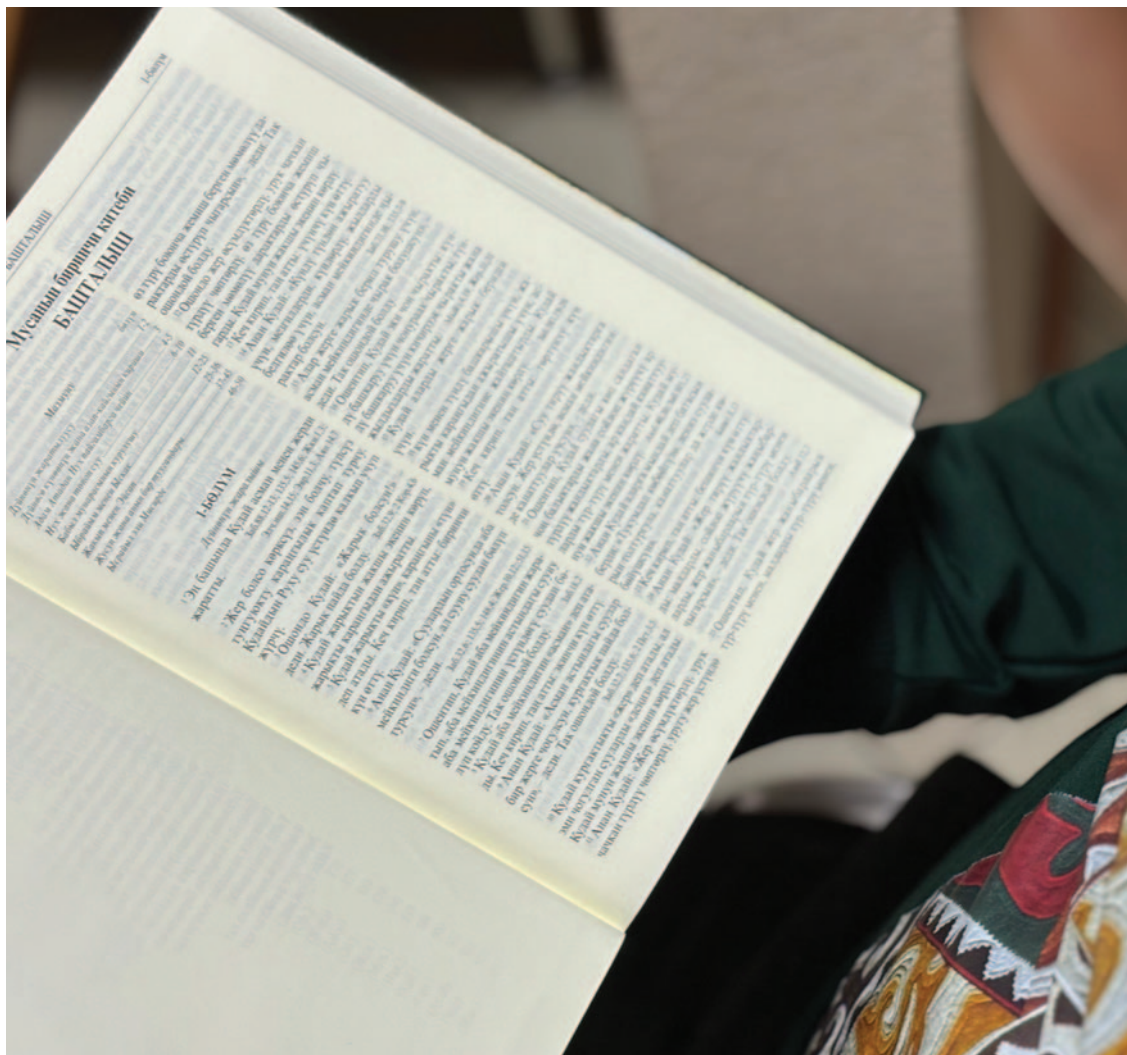
– Et nettverk av husmenigheter vokser fram i Sentral-Asia og folk er sulthne etter Guds ord, forteller en av Bibelselskapets lokale feltarbeidere som av egen sikkerhet ikke kan stå fram med navn og bilde.