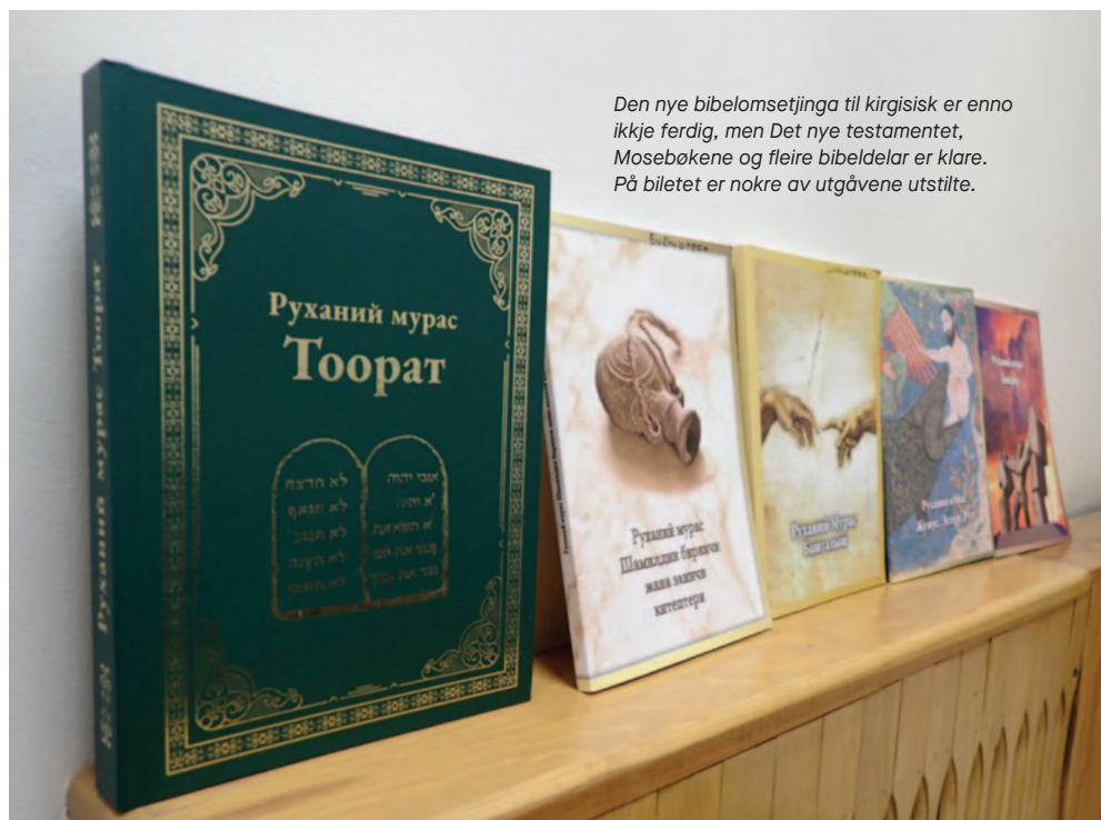
Den nye bibelomsetjinga til kirgisisk er enno ikkje ferdig, men Det nye testamentet, Mosebøkene og fleire bibeldelar er klare. På biletet er nokre av utgåvene utstilte.

– Vi fekk trykt eit nytt opplag på 3000 eksemplar i fjor. Etter fem måneder var vi nesten tome.