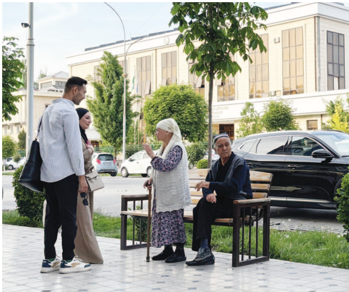
I Sentral-Asia møter mange forfølging når dei vel å følgje Kristus. Bibelens ord og fellesskapen med andre truande hjelper dei å stå oppreist i motgangen. (Illustrasjonsfoto)